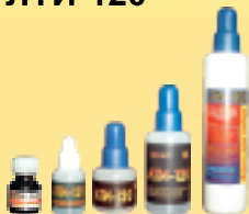
10мл. 15мл. 25мл. 50 мл. 100мл.

10 мл. Стекло́нная бутылка с основной и контрольной крышкой.